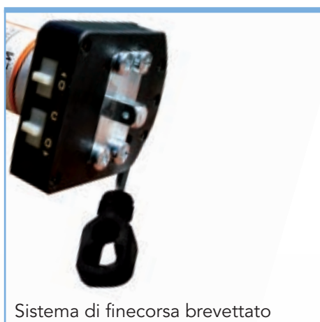
Sistema di finecorsa brevettato

Motore tubolare con finecorsa semiautomatico e manovra di soccorso