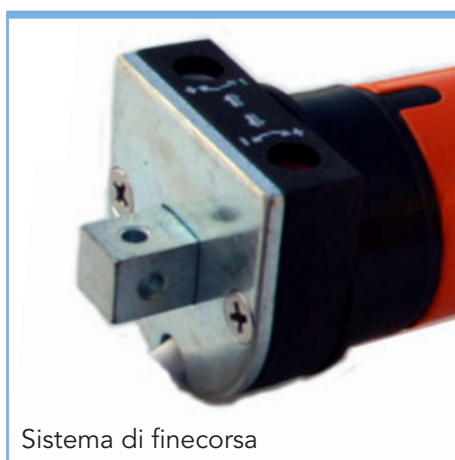
Sistema di finecorsa

Motore tubolare con finecorsa meccanico per sistemi avvolgibili di piccole dimensioni